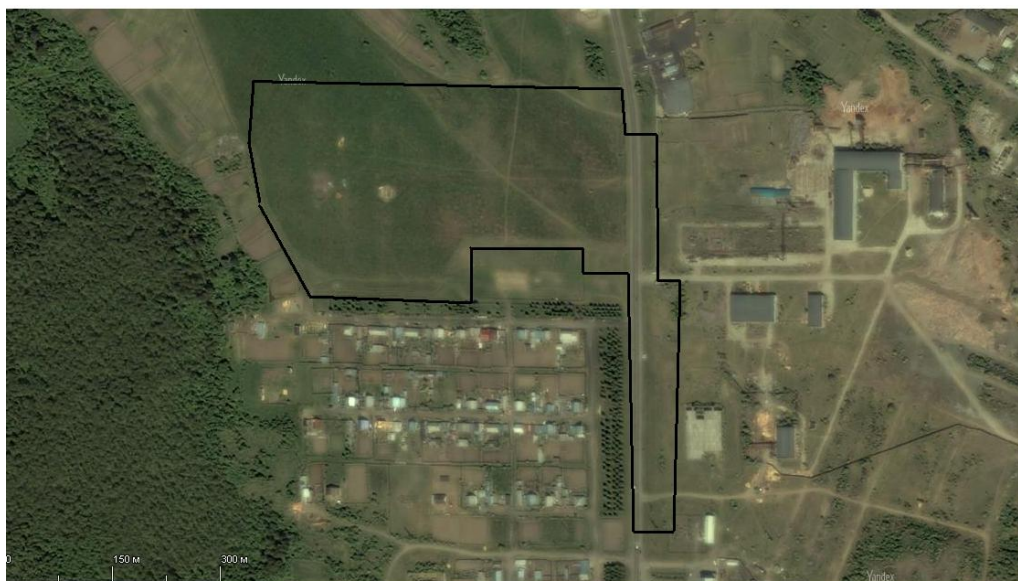
Рисунок 1. Ситуационный план участка работ

Сейсмичность - до 6 баллов по шкале Рихтера.